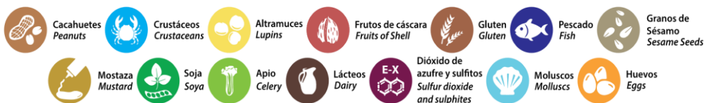
TABLA DE ALERGENOS

Si tiene alguna duda sobre la presencia de alérgenos en alguno de nuestros platos, no dude en preguntarnos.